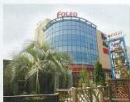
四季の森フォレオ (横浜市)