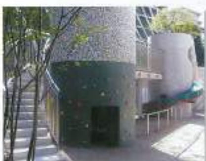
育英幼稚園建設施設 (広島市)