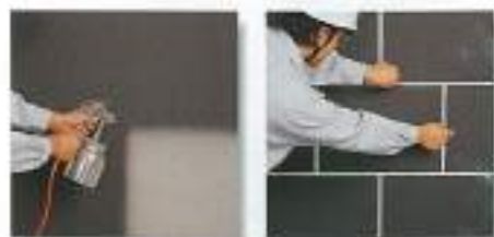
Primer 1.下塗り Ring Stickers 2.目地貼付