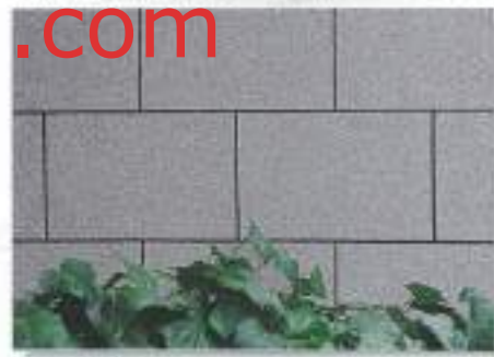
After Completion 完成