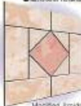
Modified Amida Pattern