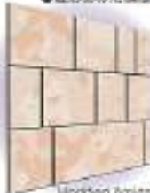
Modified Amida Pattern