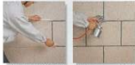
Removing Stickers 5.目地取り Top Coat 6.上塗り