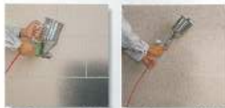
Under Coat 3.中塗り Base Coat 4.土粉塗り