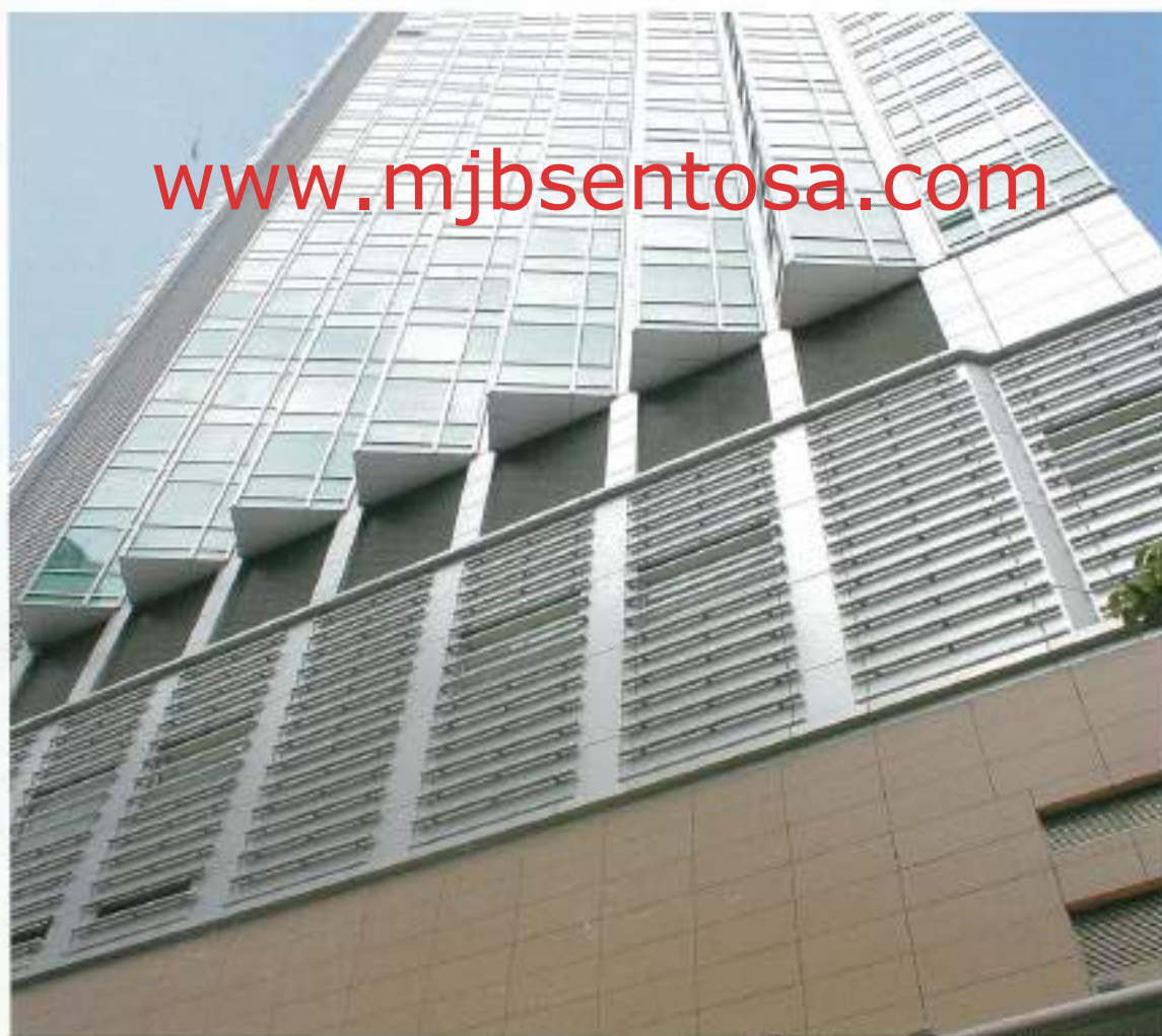
L' Hotel Causeway Bay Harbour View (Hong Kong)